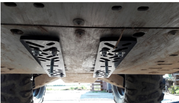
Fig. 3: Huvudplattor

Sätt M12x35-bultarna i de rektangulära hålen i huvudplattorna och montera plattorna med ATV-rambeslagen. Dra inte åt muttrarna än.