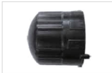
1. Hölje (droppjustering)