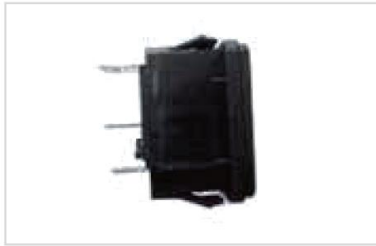
10. Tillbehör kontakt