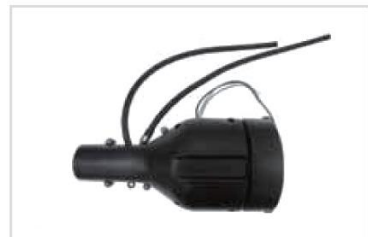
6. Motorskydd tillbehör