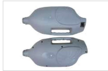
11. Skyddskåpa höger/vänster