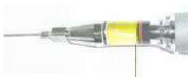
Indstilling af dosering