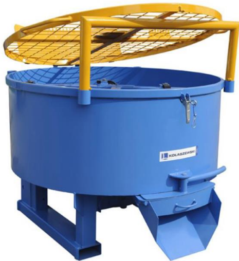
Tvangsblander set bagfra