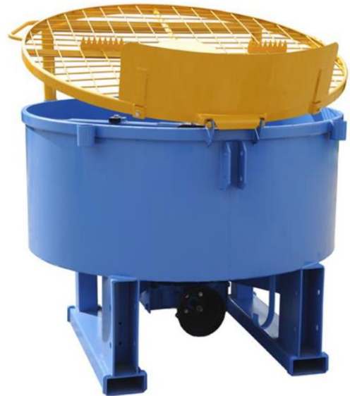
Tvangsblander set forfra

Tvangsblanderen består af to dele: En blandeбалje med ophæng og en omrører, som befinder sig i blandeбалjen. Blandeбалjen er udstyret med sikkerhedslåg og profilerede fødder, som gør det muligt at flytte udstyret med gaffeltruck/palleløfter. Sikkerhedslåget fungerer også som si med skær til åbning af poser.