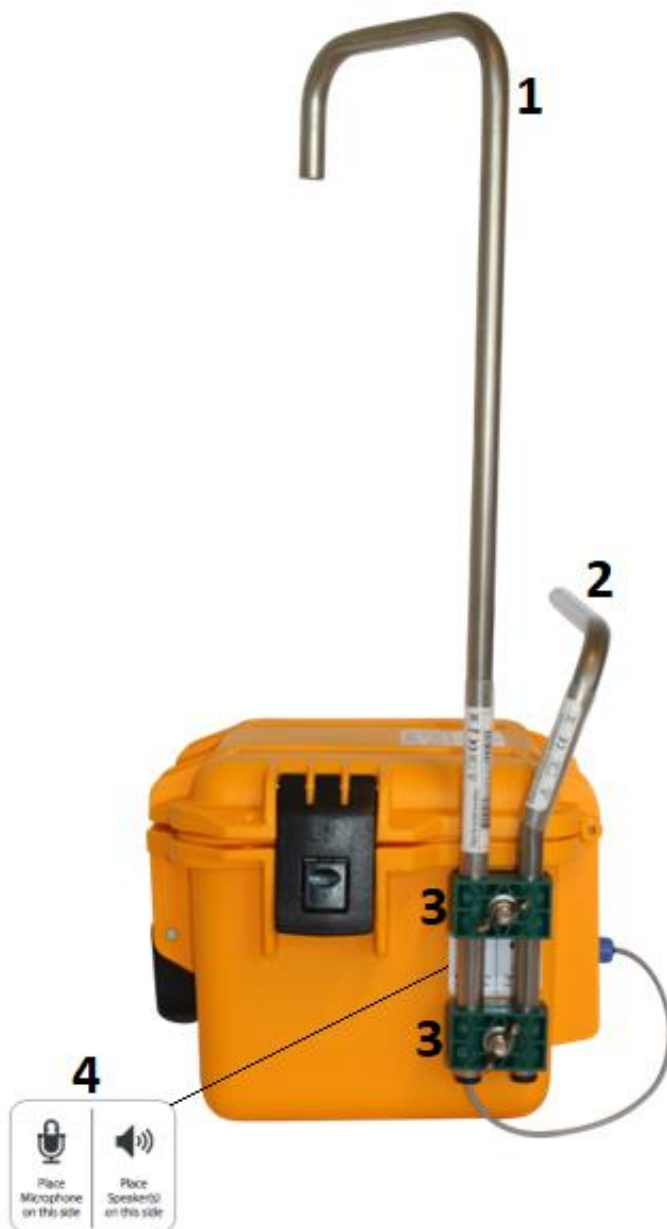
Figur 4 - Systemet fra højre