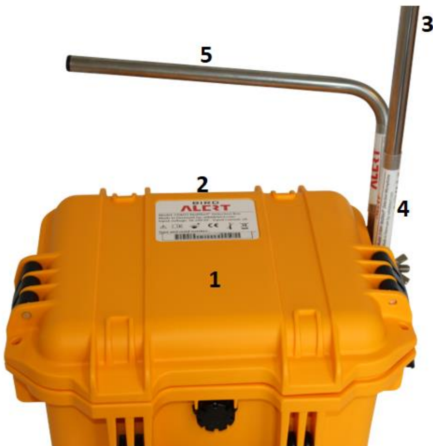
Figur 3 - Systemet ovenfra