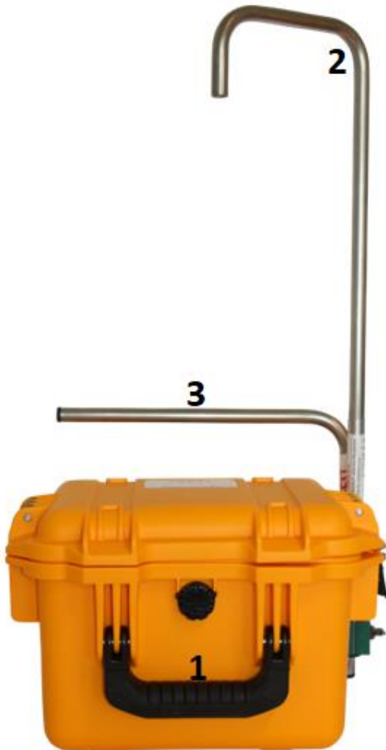
Figur 5 - Systemet forfra