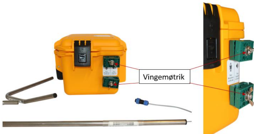
Figur 7 - Vingemøtrikkerne løsnes

1: De grønne beslag løsnes ved at dreje vingemøtrikkerne imod uret, så langt det er muligt, uden at møtrikkerne falder af skrueerne.