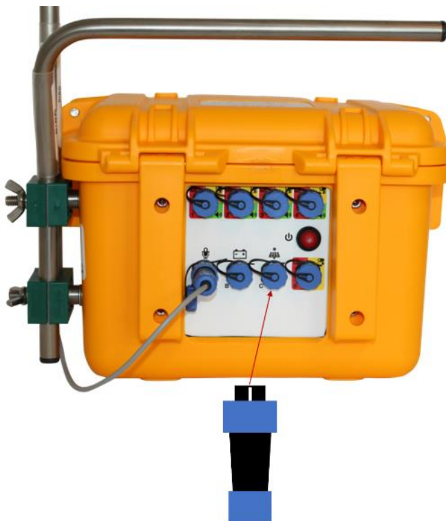
Figur 11 - Tilslutning af AC til DC omformeren

Hanstikket spændes fast til hunstikket ved at dreje den yderste blå ring på stikket med uret.