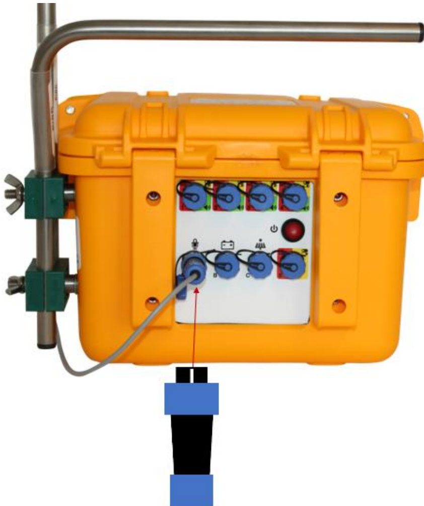
Figur 10 - Tilslutning af mikrofonen

Hanstikket spændes fast til hunstikket ved at dreje den yderste blå ring på stikket med uret.