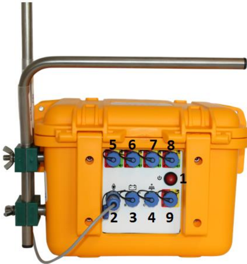
Figur 6 - Systemet bagfra