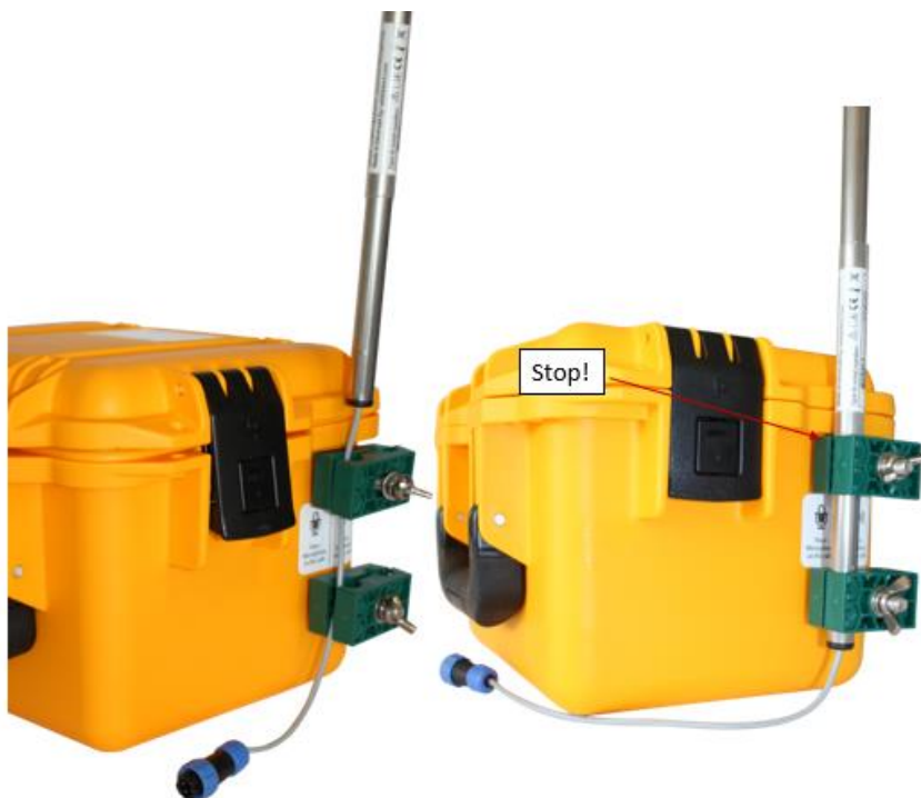
Figur 8 - Påspænding af mikrofonen

2: Mikrofonkablet trækkes forsigtigt ind imellem beslagene til venstre, som vist på figur 8. Herefter trækkes BirdALert™ detektionsmikrofonen forsigtigt nedad, indtil plastikken omkring mikrofonarmen rammer det øverste beslags overside. Hvis BirdALert™ højtalerarmen er tilvalgt, er det en fordel at montere den samtidig med mikrofonen på detektionsboksen. Stram vingemøtrikkerne indtil mikrofonen holdes på plads, men stadig kan drejes.