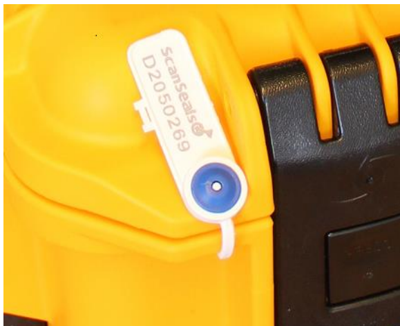
Figur 1 – Plombering på BirdAlert boksen