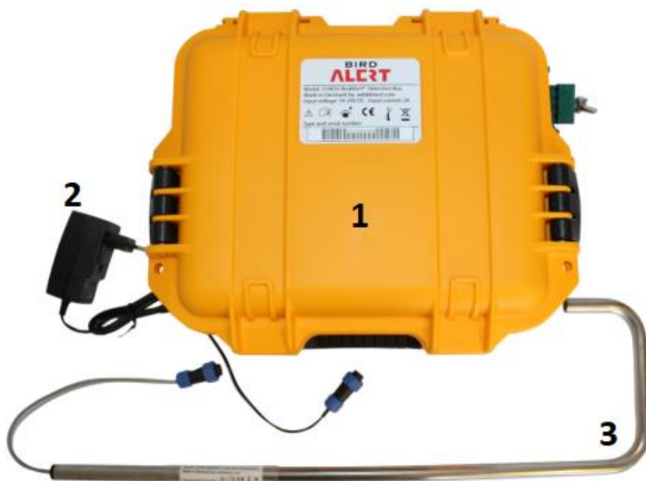
Figur 2 - System overblik

BirdAlert™ AC til DC omformeren kan bruges til indendørs opladning af det interne batteri i BirdAlert™. Det er også muligt at tilvælge et solpanel eller en udendørs oplader til BirdAlert. Se mere på www.wilddetect.com .