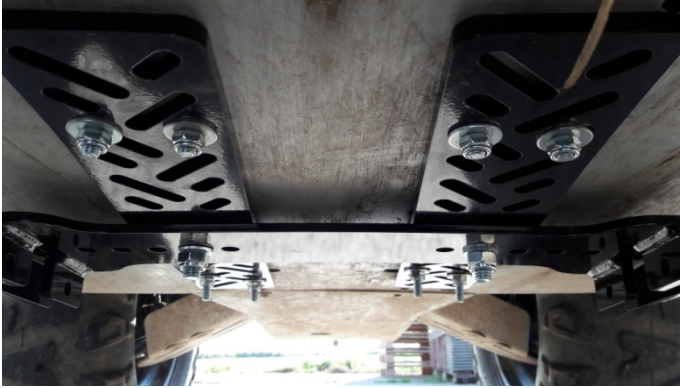
Abb. 4: Montage

Befestigen Sie den Beschlag an den Hauptplatten. Ziehen Sie alle Verbindungen fest.