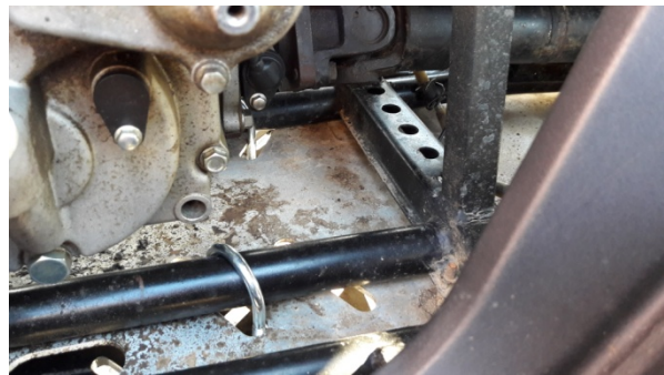
Abb. 1: Die ersten Bügel wurden montiert Abb. 2: Bügel, Ansicht von oben