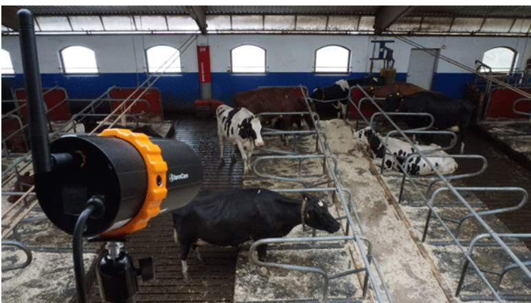
Flera övervakningskameror håller koll på dieseltank, kalvningsbox och foderbord. De kan också larma vid rörelsedetektion.

- Oerhört värdefullt att kunna stänga av strömmen lätt via mobilen för att snabbt kunna laga, och sedan enkelt kunna slå på strömmen igen.