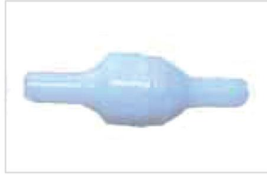
8. Check Valve