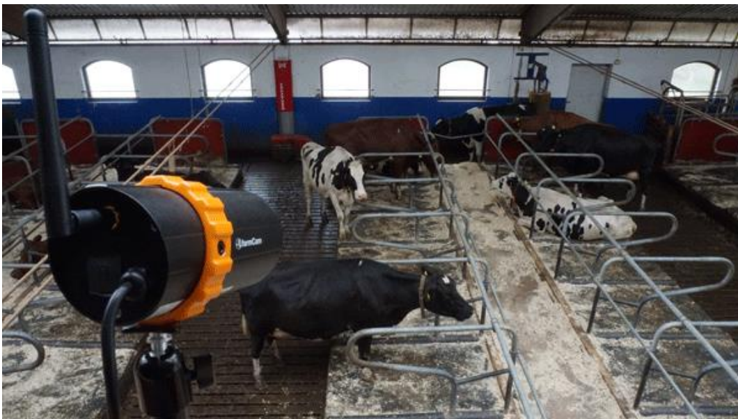
Flere kameraer på gården overvåger bl.a. dieseltanken, stalden og fodermængden. De kan også indstilles til at give en alarm ved bevægelser.